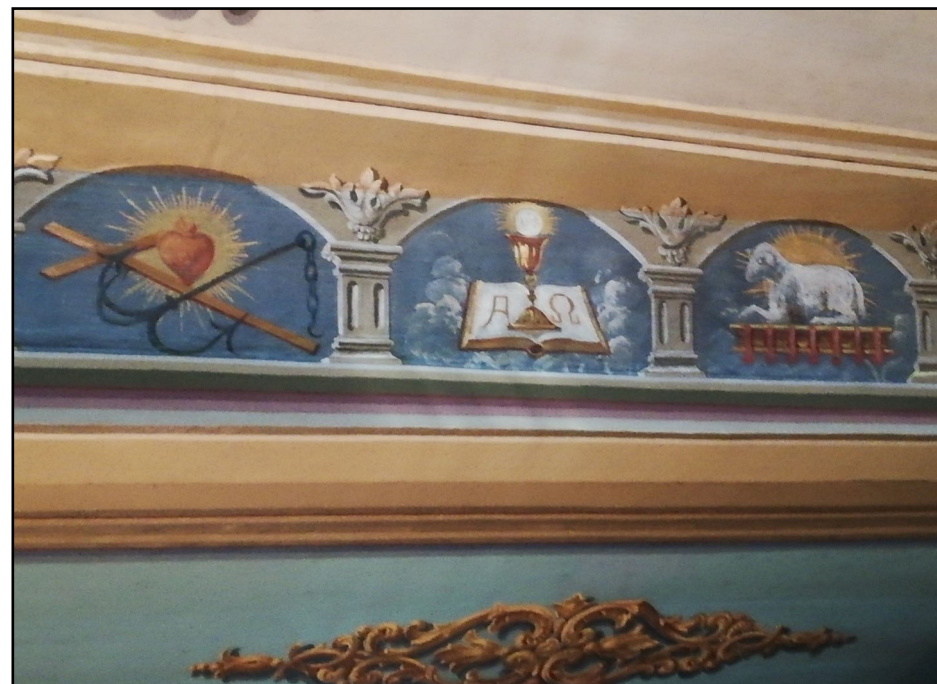
Freski z kościoła z ksiąg Starego Testamentu - Biblia ubogich.