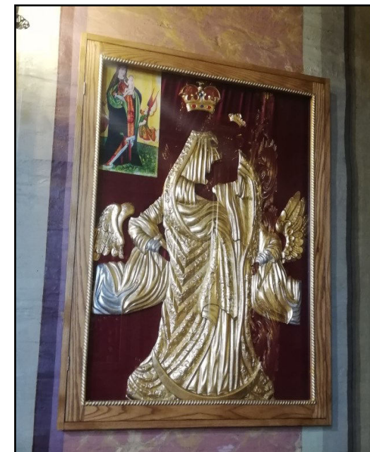
Wygląd sukienki Matki Bożej przed i po konserwacji...