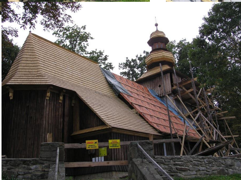
Poszczególne fazy remontu kościoła prowadzone w latach 2003 - 2006