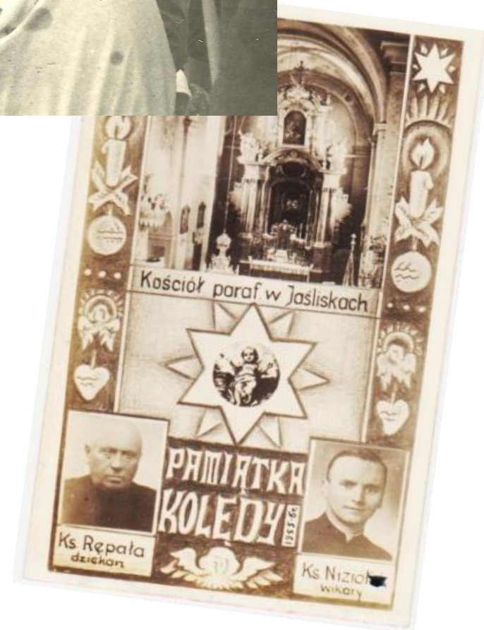
Pamiątka z wizyty duszpasterskiej ks.dziekana W. Rąpały u parafian; 1955/ 1956