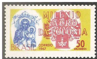
Wydania pocztowe USA, Brazylii i Polski (godło bez korony) upamiętniające Milenium

W życiu Parafii odzwierciedliła się rola przykrych doświadczeń związanych z uwięzieniem obrazu M.B. Częstochowskiej. Władze PRL-u w przeciwieństwie do obchodów 1000-lecia Chrztu Polski ogłosiły obchody 1000-lecia Państwa Polskiego. W obawie przed klęską własnych obchodów i glorią chrześcijaństwa w ateistycznym państwie zakazały peregrynacji obrazu M.B. Częstochowskiej. Obraz uwięziony został przez MO w miejscowości Liksajny w dn.22.06.1966 r. Decyzją Episkopatu przez Polskę, przez ponad 7000 parafii w latach 1966 do 1972 r., wędrowały zamiast obrazu ramy z symboliczną świecą dając niezbity dowód władzy na niebywałe przywiązanie ludu do chrześcijaństwa.