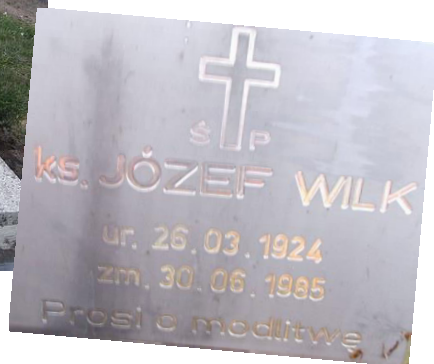
< Tablica zamontowana na krzyżu