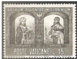
Za czasów panowania Mieszka I i Dobrawy Polska przyjęła Chrzest w 966r.